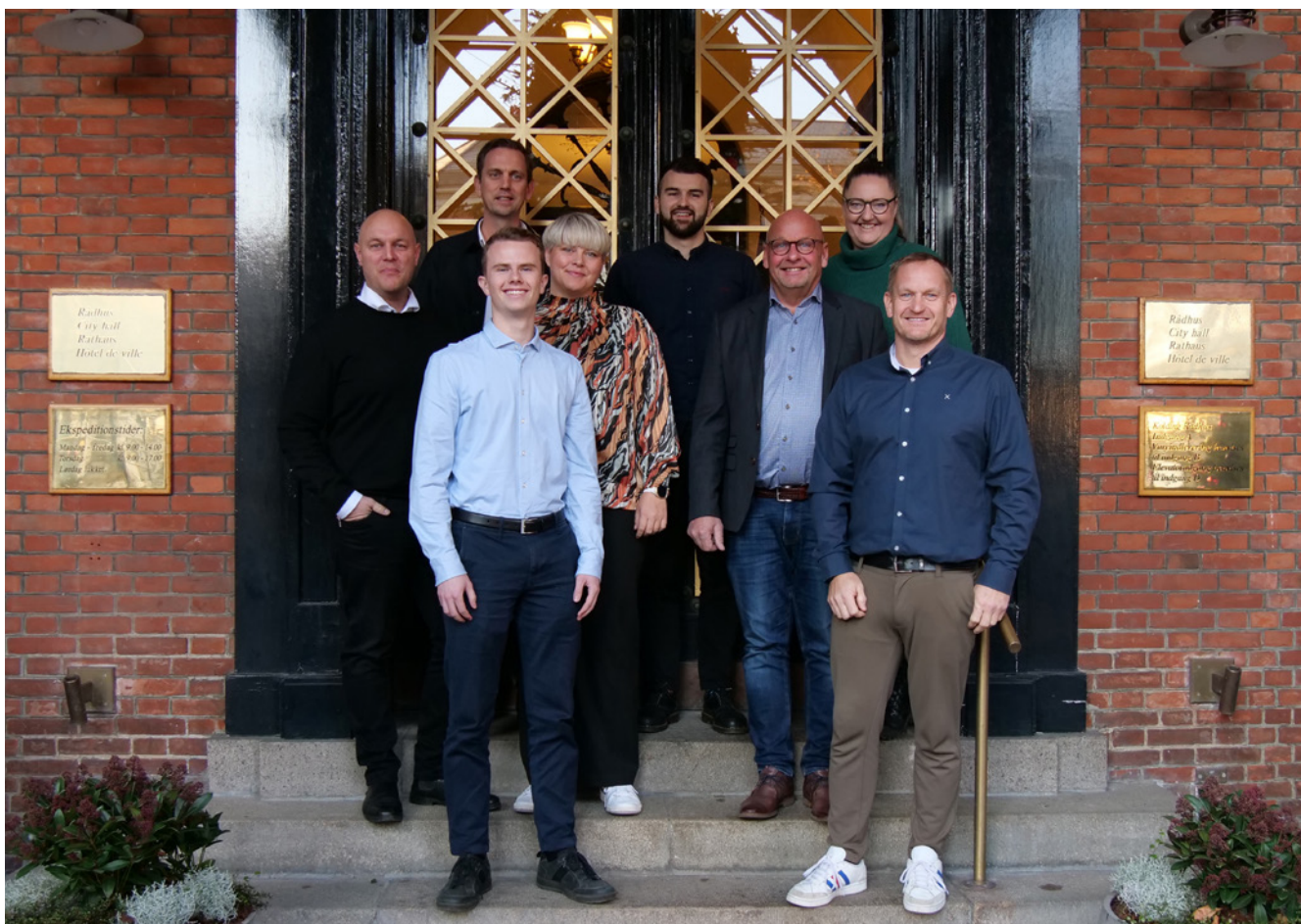
Note: Søren Rasmussen er også medlem af Udvalget Børn og Uddannelse.